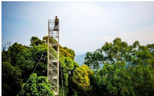
Canopy Walk 天桥