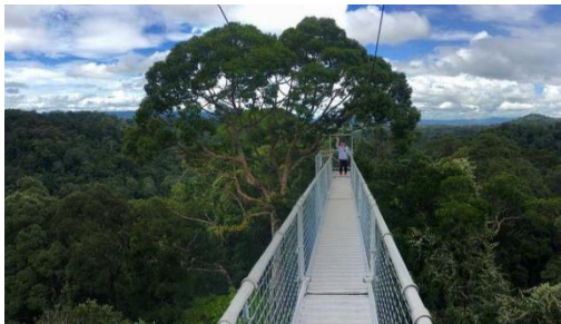
Canopy Walk 天桥